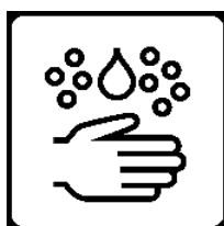
Gründlich Hände waschen/desinfizieren