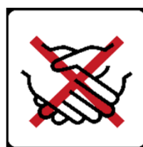
Hände schütteln vermeiden