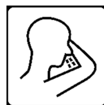
In Tschentuch od. Armeuge husten/niesen